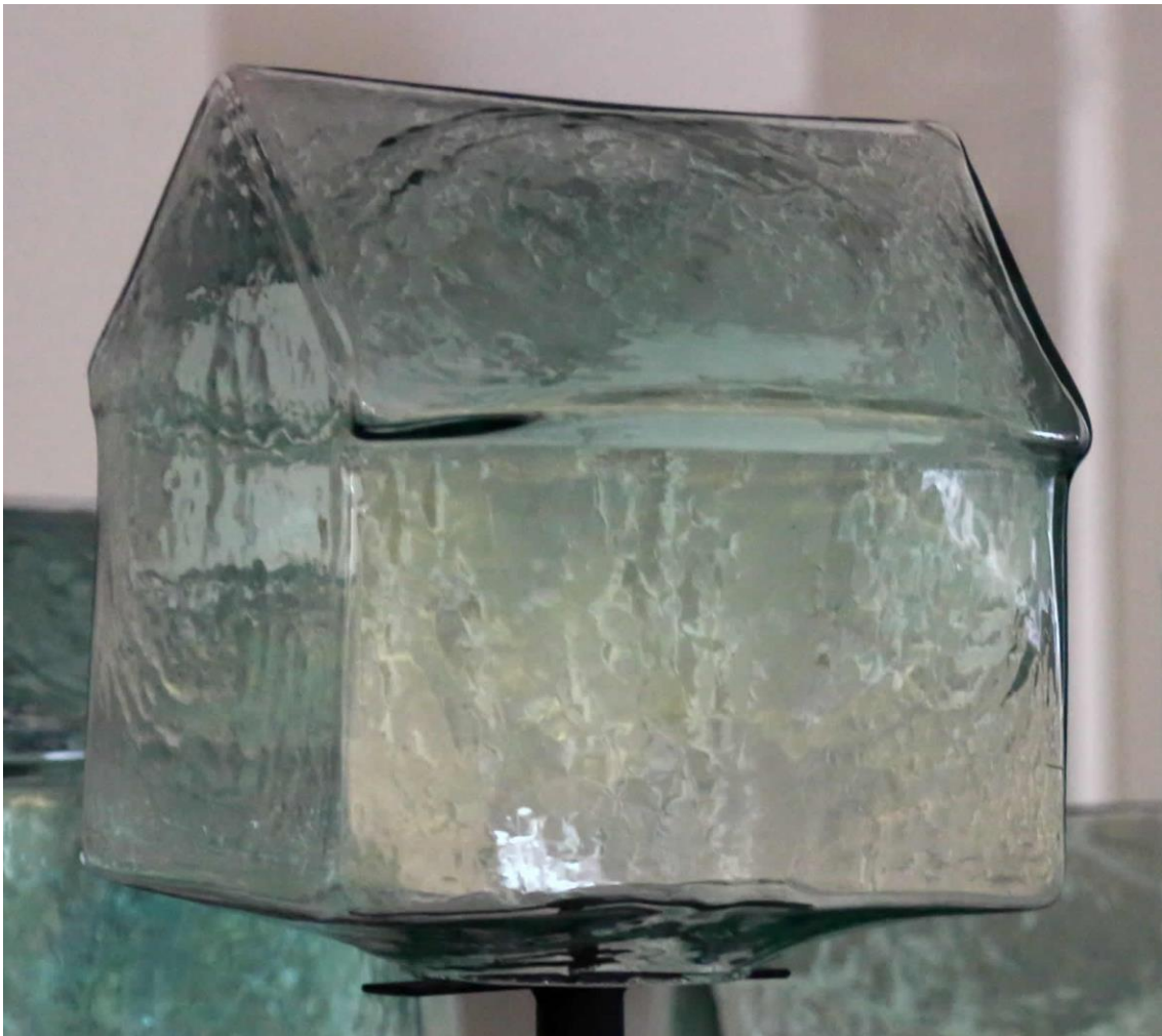
Casa Tierra 2016

Menciona la artista en su publicación sobre ‘Crisoles’ las palabras de Jean-Luc Goddard y Anne-Marie Miéville, en ‘Voyages en utopie’, en el Centro Pompidou (2006): “Estamos perdidos en la inmensidad del universo y en la profundidad de nuestro propio espíritu. No hay manera de retornar a casa, no hay casa. La especie humana se encuentra agotada y dispersa en las estrellas. No podemos enfrentar el pasado ni el presente, y el futuro nos lleva aún más lejos del concepto de hogar. No estamos libres, como nos gustaría creerlo, sino perdidos.”