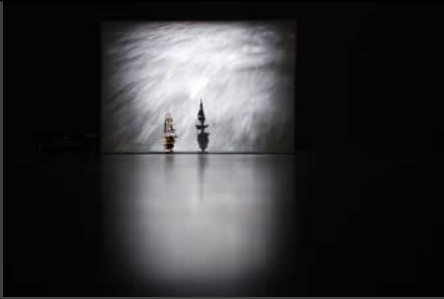
Expulsión del Paraíso , Premio Luis Caballero