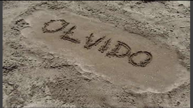
Olvido de arena , 2007. Parte de la colección del MOLAA, La galería Gabriela Mistral (Chile), Universidad Nacional de Colombia.

“Bahía Inútil” es el lugar en el fin del mundo, donde los mares se encuentran, la tierra termina y los hombres aparecen como acordes en el viento. Se trata de acciones poéticas que evocan la memoria del fin del mundo, testigo de las dictaduras del Sur.