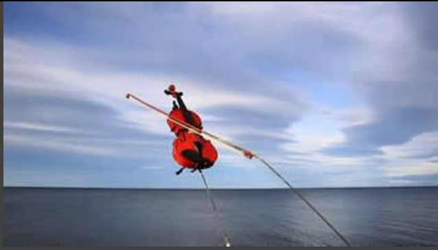
Solo de violín , 2010. Parte de la colección del Banco de la República.

En los años 70s algunos hombres del Sur del continente (Chile y Argentina) fueron desterrados a las islas del fin del mundo, nunca regresaron, allí el paisaje tiene nombres tristes: Golfo de Penas, Bahía Última Esperanza, Isla del Muerto, Península de la Desilusión. El viento joven y fuerte busca a los desaparecidos con furia, a veces grita sus nombres y los escribe en el aire de Bahía Inútil.