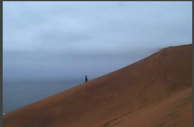
Scarabeus Sacer , 2006. Bienal de Venecia

Muestra una acción reiterativa y absurda en el paisaje, una acción necia, sin sentido y representada como reiteración del caminar, un ascenso sin fin por una montaña de arena, un gesto simbólico que sintetiza y hace metáfora entre la búsqueda del progreso como una obstinación de las civilizaciones y el andar del Escarabajo Pelotero ( Scarabeus Sacer ), el hombre que intenta ir hacia arriba en un terreno estéril e insulso y se enfrenta al fracaso de una escalada torpe y débil, donde su idea territorial se ha desvanecido, sin puntos de apoyo sólidos, frente a condiciones del medio ambiente social que arremeten implacable en contra de la vulnerabilidad de lo humano.